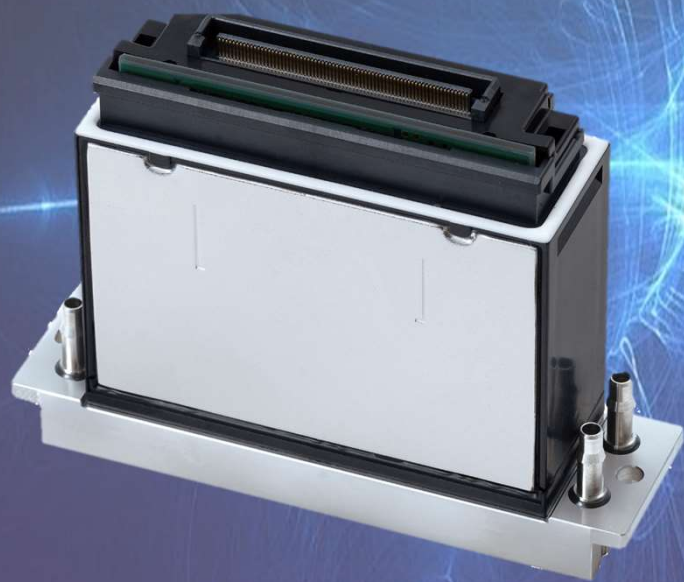
産業用インクジェット RICOH MH5320/5340