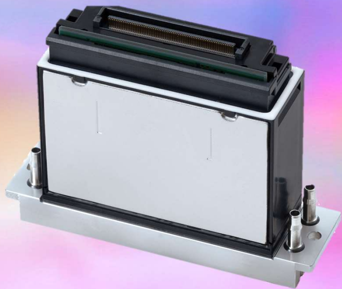
産業用インクジェット RICOH MH5320/5340