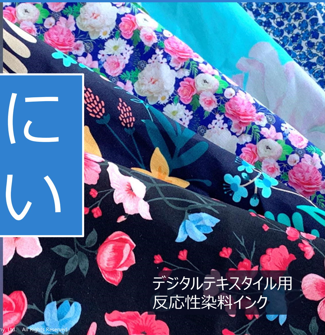
デジタルテキスタイル用 反応性染料インク